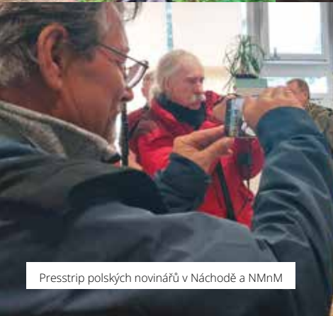
Presstrip polských novinářů v Náchodě a NMnM