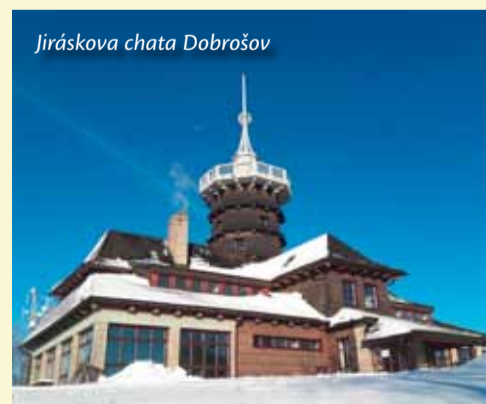
Jiráskova chata Dobrošov

V roce 2023 oslaví královna náchodských kopců 100 let a právě vaším darem k tomuto jubileu může být malý finanční příspěvek na její obnovu.