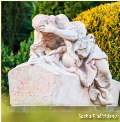
Socha Plačící ženy

Jméno barokního sochaře Matyáše Bernarda Brauna často slyšíme ve spojitosti s nedalekým hospitálem Kuks či sochařskou výzdobou Karlova mostu v Praze. Dvě významné památky nesoucí podpis tohoto barokního veličana najdeme také v Jaroměři.