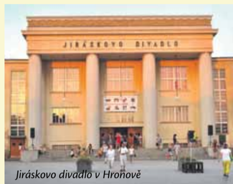
Jiráskovo divadlo v Hronově

Hronovským Jiráskovým divadlem krácela historie a vy jí můžete být v patách téměř celoročně. Nenašli jste do divadla jen malými kruhovými okýnký zavřených dveří, ale stavte se na komentovanou prohlídku a projděte divadlo s průvodcem od základního kamene až po půdu.