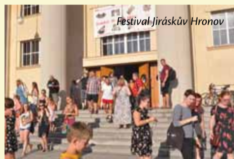
Festival Jiráskův Hronov

Jak vypadá zákulisí Jiráskova divadla? Jaké používají herci šatny? Kde ožívají světla? Kolik muzikantů se vejde do orchestřiště? Kde je uložen základní kámen? A co nějaká veselá historka? Na tyto i další otázky vám odpoví připravený průvodce. Divadelní technici vás také nechají nakouknout do bývalé promítací kabiny, odkud dnes ovládají zvukařský a osvětlovačský pult. Jak vše v kabině během představení probíhá? Co musí všechno zvukaři