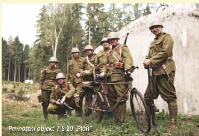
Pevnostní objekt T-S 20 „Pláň“

Text: Lucie Dostálová