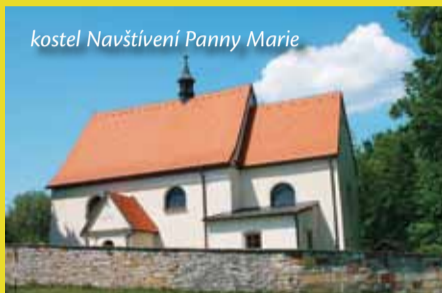
kostel Navštívení Panny Marie

V nové rubrice vám budeme představovat obce Kladského pomezí spolu s příběhy a pověstmi, které jsou s nimi spojené. Jako první jsme vybrali Slatinu nad Úpou, obec mezi Českou Skalicí a Červeným Kostelcem, protkanou turistickými trasami, cyklotrasami i naučnými stezkami.