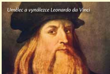
Umělec a vynálezce Leonardo da Vinci

Odvěká touha vzlítout k oblakům poháněla člověka k vynalézání mnoha způsobů, jak