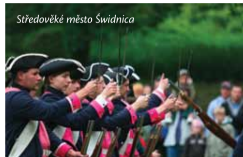
Středověké město Šwidnica

Text: Jiří Švanda