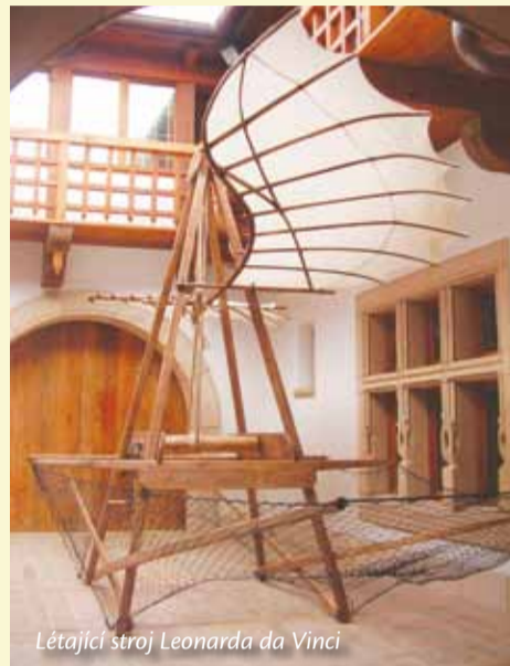
Létající stroj Leonarda da Vinci

Zámek rodiny Bartoň-Dobenín v Novém Městě nad Metují chystá pro své návštěvníky i v letošním roce nabitý kulturní program. Hlavním lákadlem k návštěvě v období letní sezóny bude bezpochyby unikátní výstava „Aeronautica – létající stroje Leonarda da Vinciho“.