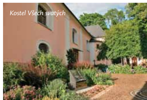
Kostel Věch svatých

Okolí kostela Věch svatých v Hronově získalo novou tvář. V polovině minulého roku zde byla provedena celková rekonstrukce bývalého hřbitova.