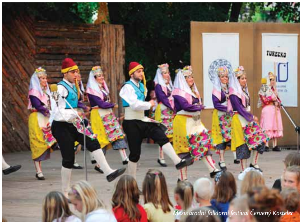
Mezinárodní folklorní festival Červený Kostelec