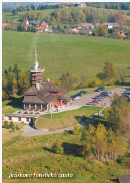
Jiráskova turistická chata

V roce 2023 oslaví Jiráskova chata sto let a spolek KČT Náchod si připomene sto třicet let své existence. Máme před sebou ještě pět let na to, abychom se vyrovnali s nedostatky, které dnes Jiráskovu chatu velmi tíží.