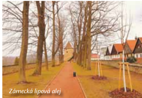
Zámecká lipová alej

V areálu zámku v Novém Městě nad Metují se počátkem května opět otevře část zámecké zahrady, která byla po několik let skryta očím veřejnosti. Znovu zpřístupněným místem je lipová alej na bývalém obranném valu.