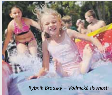
Rybník Brodský – Vodnické slavnosti