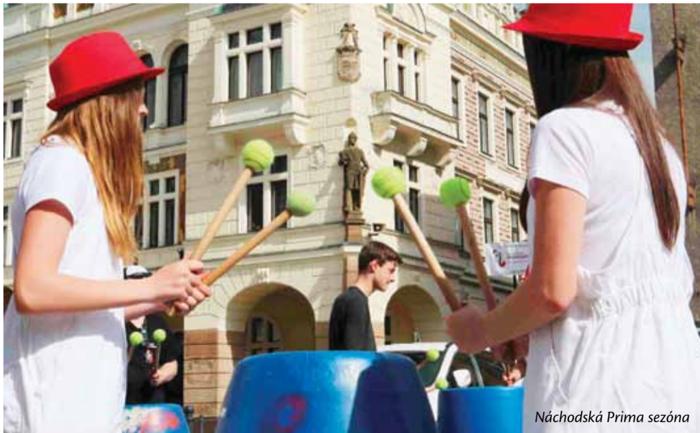
Náchodská Prima sezóna