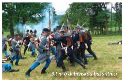
Bitva o dubenskou bažantnici

Nelehké období konce první republiky si připomeneme v nedokončené pevnosti Dobrošov , která měla bránit naši vlast před nacisty. Zde si vyzkoušíme obě role – útočníka i obránce. Provedeme rozborku a sborku zbraní, proběhneme překážkovou dráhou a vystřelíme si ze vzduchovky.