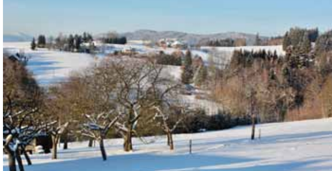
Zasněžená krajina v Brendách

Brendy, jak se dříve místně nazývaly Jestřebí hory, představují pro zdejší obyvatele a návštěvníky našeho kraje místo, které je spojováno s aktivním odpočinkem a možností relaxace. Jestřebí hory nejsou žádnými velehorami, vždyť nejvyšší vrchol Žaltman se vypíná „pouze“ do výše 739 m.n.m., ale svým ústředním umístěním v Kladském pomezí nabízí vyžití pro návštěvníky z celé řady okolních měst. Panorama hřebenu Jestřebích hor, dlouhé cca 20 km, je navíc dobře viditelné ze všech okolních míst a vytváří tak krásný obraz naší krásné podkrkonošské krajiny.