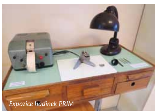
Expozice hodinek PRIM