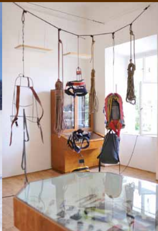
ZÁMEK - MUZEUM HOROLEZECTVÍ