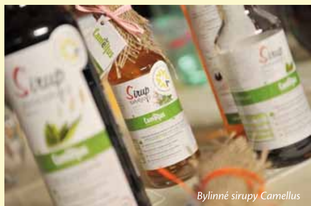
Bylinné sirupy Camellus

Kladské pomezí se nyní řadí mezi regiony s vlastní ochrannou známkou Regionální produkt - KLADSKÉ POMEZÍ. Hlavním cílem je podpora místních výrobců a propagace regionu Kladské pomezí. Jedná se o ocenění výrobků za čas a péči, která jim je při výrobě věnována, za myšlenku, která mu byla vdechnuta a za původ z regionu Kladské pomezí.