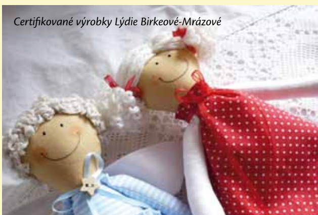
Certifikované výrobky Lýdie Birkeové-Mrázové