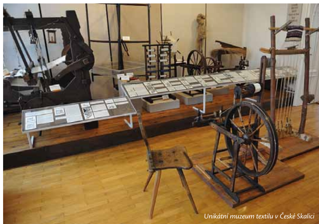
Unikátní muzeum textilu v České Skalici

V době největšího rozvoje textilního a strojírenského průmyslu zahájilo v Kladském pomezí svoji činnost také několik dalších výrobců, jejichž výrobky má jistě mnoho z nás doma, nebo někteří u nich dokonce dodnes pracují. Řeč je o celé řadě tradičních výrobců, z nichž někteří v našem regionu působí i více než 100 let. A jaké se mohou řídit mezi ty neznámější? V Jaroměři byla v roce 1859 založena firma „Černý“, která se od roku 1928 začala specializovat na šlechtění a výrobu osiv, především petúnií a begónií. První původní odrůdu, petúnie s názvem „Karkulka“, uvedli na trh v roce 1934. Od té doby zde bylo vyšlechtěno více než 120 původních odrůd petúnií, begónií, bramboříků, konvalinek a dalších druhů květin. Vyšlechtěné odrůdy obdržely celou řadu medailí. Dnes v zahradnictví nabízejí kromě květin a jejich semen také semena zeleniny a široký sortiment zahrádkářského zboží. Jedním z nejstarších tradičních výrobců v našem regionu, který je dnes znám po celém světě, je náhodský pivovar Primátor, založený roku 1872. První zmínky však sahají až do roku 1448. Přesně 6. prosince 1873 bylo uvařeno první pivo. Dnes se odtud pivo dováží do 33 zemí světa a ochutnat můžete z více než 15 druhů piv. V Úpici ve druhé polovině 19. století byla zahájena výroba vah pro obchod a průmysl. V roce 1894 se zde vyráběly stolní kupecké váhy a váhy pro domácnost. Postupně se začaly vyrábět i další druhy vah a v roce 1950 vznikl samostatný podnik TONAVA (továrna