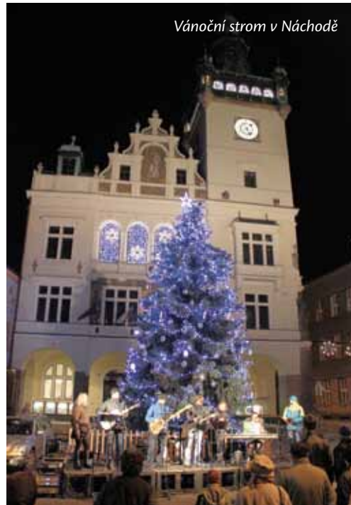
Vánoční strom v Náchodě

Text: Lucie Dostálová, MIC Náchod