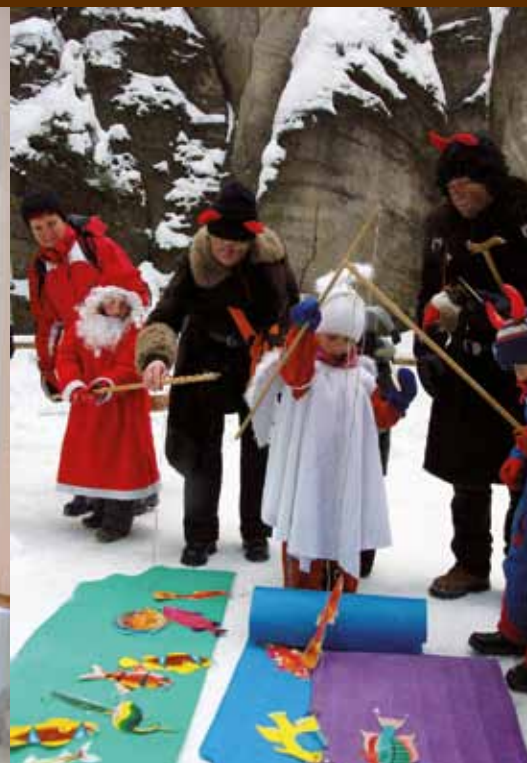
ZÁBAVA PRO RODINU

Adršpašské skály jsou přístupné celoročně, takže teď končí pouze letní sezóna. Na co se můžete těšit? Zimní vodopád, Čertohrátky v Adršpašských skalách, Dřevorubec roku v Adršpachu. Pokud sněhové podmínky dovolí, tak jsou pro vás strojově upravovány běžecké trasy v Adršpachu i okolí. Po příjemně stráveném dni se můžete ohřát a posedět si v prostorách zámku, vychutnat si kávu a jiné nápoje. Budova je v zimních měsících otevřena denně kromě pondělí od 9:00 do 16:00 hod.