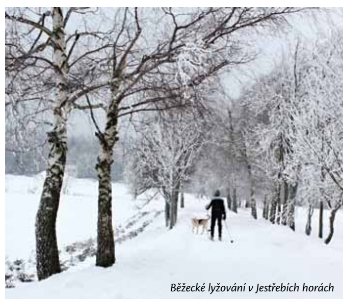
Běžec lyžující v zasněženém lesu

Text: Ing. Roman Kejzlar, TIC Červený Kostelec