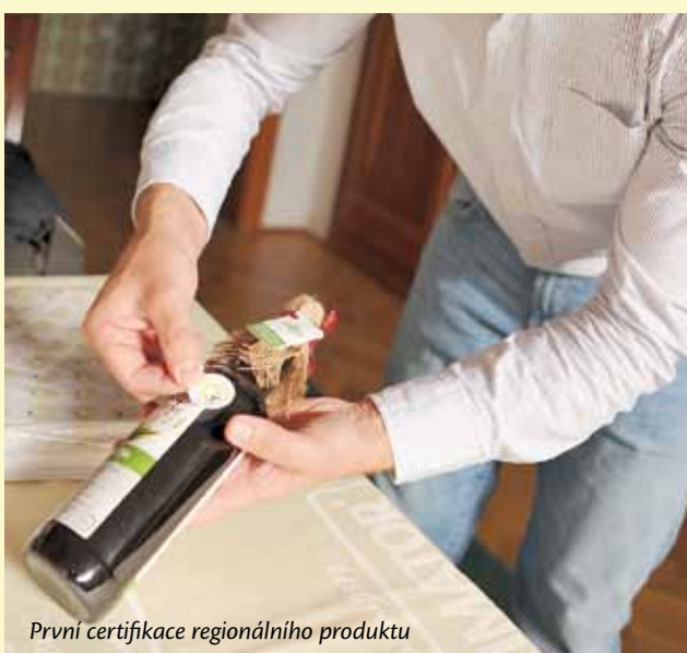
První certifikace regionálního produktu